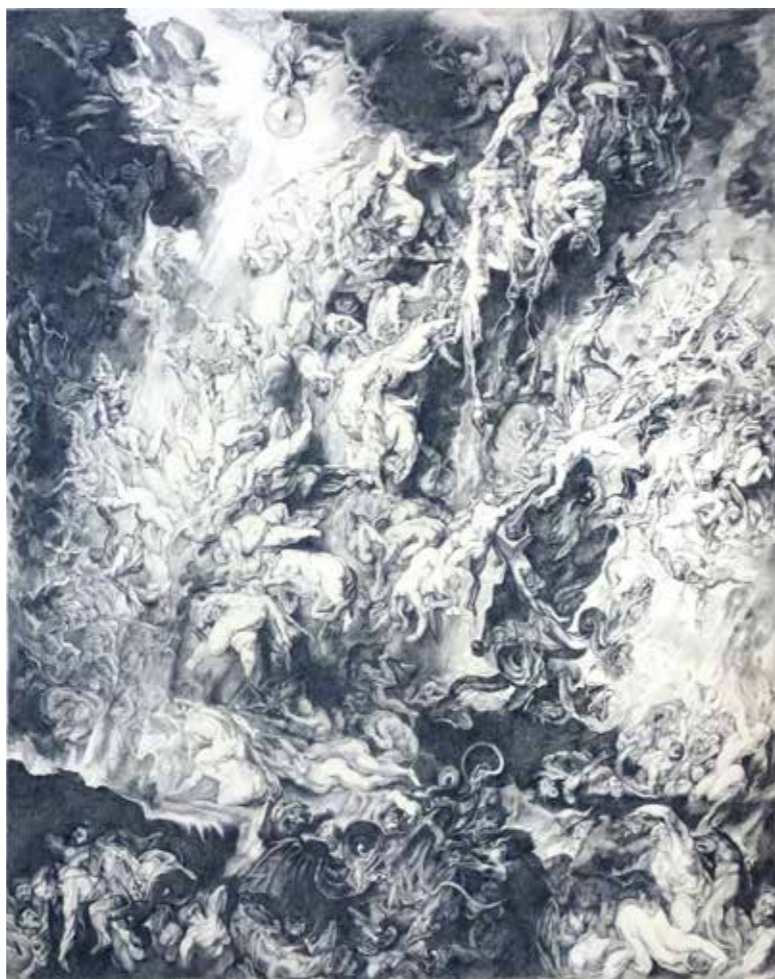
dessin, 2019, crayon de couleur monochrome (186x143 cm).

Cette réinterprétation, divisée en 20 rectangles de même taille, devient l'écran dynamique de la série des Portraits d'exil .