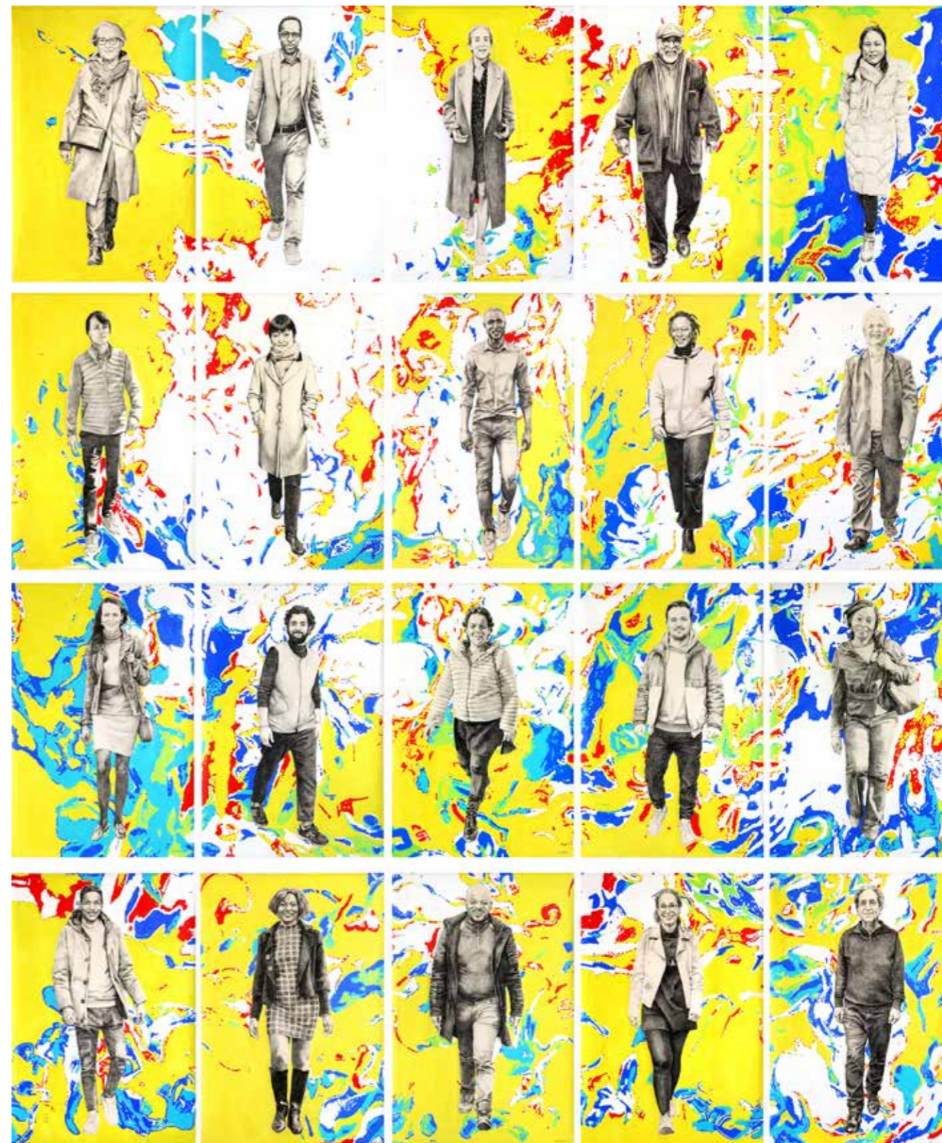
Série Portraits d'exil, acrylique et fusain sur toile de coton, 20 x (160x110 cm)

Il permettra, au-delà de l'exposition, de découvrir plus largement l'histoire unique et bouleversante de chacune des personnes qui a participé au projet, mais aussi de nourrir une réflexion sur l'exil, sur notre rapport à l'art et à la création dans le temps que nous vivons.